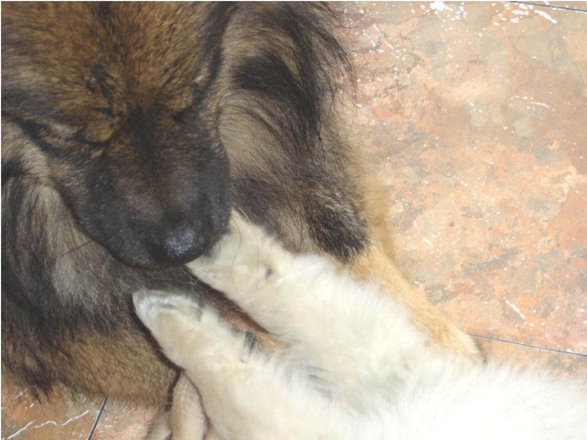
Ce chiot Finnish Lapphund démontre une attitude soumise face à notre Eurasier Black Motion Simba of Eurasia . Cela fait partie de la communication non verbale du chien (body language) que nous devons comprendre et utiliser dans tout programme d'éducation canine.

Votre chien a été entraîné à l'obéissance et il exécute tous vos commandements sans problème. Bien... mais ça n'a rien à voir avec l'attitude d'un leader! L'obéissance est un travail. Vous le faites de 9h00 à 17h00 et après le travail, vous faites de votre mieux pour l'oublier et relaxer! C'est la même chose pour votre chien. En laisse, dans une école d'obéissance, le chien fait son travail. Mais au retour à la maison, si le leadership n'est pas là, le chien 'oublie' son obéissance ce qui peut devenir un vrai challenge pour ses propriétaires! Le leadership n'est pas basé sur des mots. Le leadership est basé sur votre communication non verbale, ce qu'on appelle communément le body language .