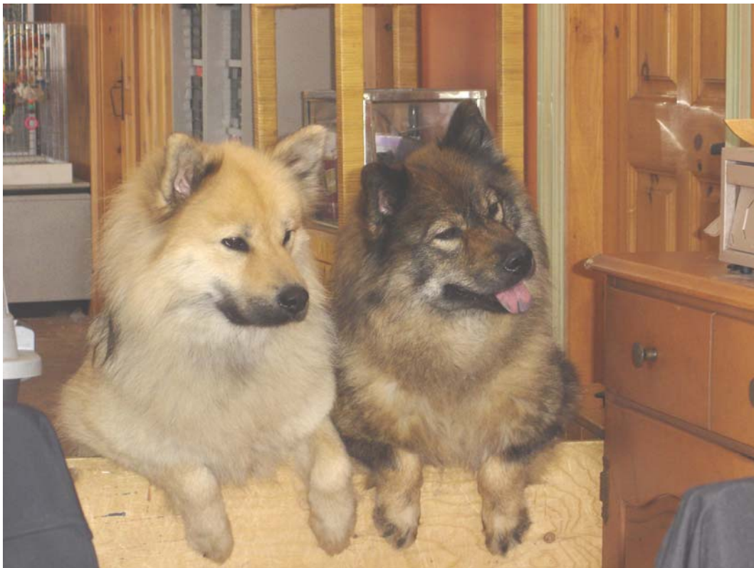
Eurasiers : Dancing Bear Ally to Eurasia & Fatal Attraction of Eurasia

Le comportementaliste Cesar Millan explique le leadership comme une énergie et j'aime bien cette comparaison. L'énergie est partout... positive et négative. Lorsque votre propre énergie est positive, votre chien y répondra de façon positive parce que votre langage non verbal est en accord avec cette énergie. Mais lorsque votre énergie devient négative (peur, frustration, anxiété, colère, tristesse) votre chien la ressent et l'interprétera comme une énergie stressante. Certains chiens réagiront en démontrant des comportements de peur, d'autres deviendront agressifs. C'est de cette façon que l'énergie va et vient.