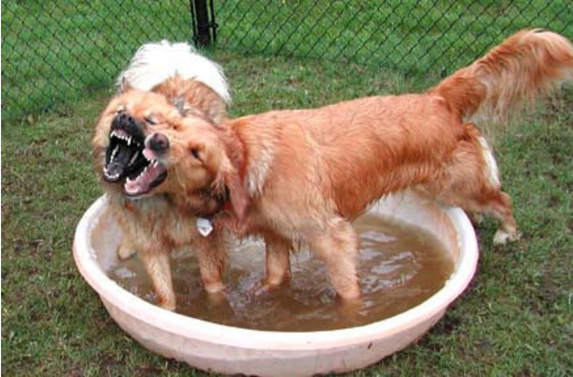
Eurasier : Cassandra of Eurasia & son ami Golden Retriever

Le leader est celui qui devrait toujours contrôler les jeux et les gagner. Lorsque le leader décide d'arrêter le jeu... le chien doit le respecter.