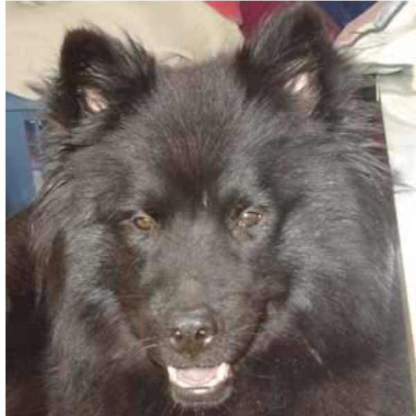
Eurasier : Vanille de NiouTchouang