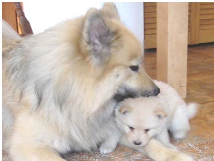
Eurasier : Dancing Bear Ally to Eurasia éduque un chiot Finnish Lapphund âgé de 4 semaines.