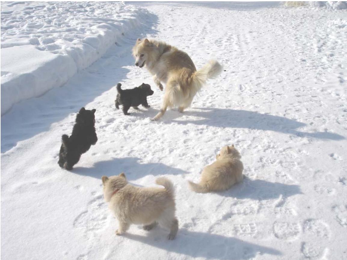
Finnish Lapphund : Sugarok Ayla Fleur of Eurasia & sa portée

L'Eurasier ne fait pas exception. Comme son ancêtre le loup, l'Eurasier a besoin de vivre en groupe. Mais qu'est-ce exactement qu'un groupe (meute)? L'Eurasier qui partage notre vie aujourd'hui n'est pas un loup. L'Eurasier fut développé pour être notre compagnon bien-aimé qui partage notre vie. Après plusieurs générations, tous les chiens ont perdu la plupart des attitudes du loup et ont développé une communication spécifiquement canis familiaris . Cette communication canine est un peu différente de celle du loup.