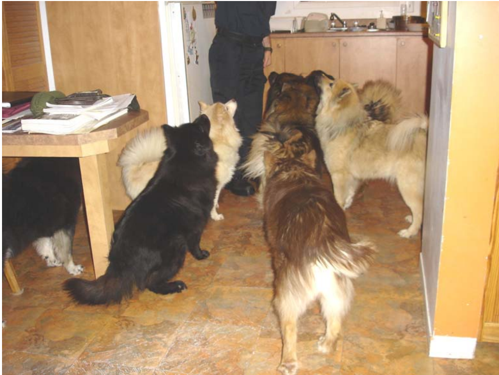
La meute Eurasia dans notre cuisine... photo 2006

Pour obtenir du succès en éducation canine, tous les propriétaires doivent devenir le meilleur ami et la mère de leur Eurasier. Un leader calme, en qui on peut avoir confiance fait le meilleur ami et la meilleure maman. Un leader établi des règles et les fait respecter. Un manque de leadership ouvre la porte aux comportements indésirables.